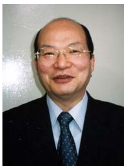
日本薬科大学教授 百済診療所院長 医学博士