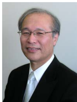
神奈川県立保健福祉大学教授 同栄養学科長 管理栄養士、医学博士