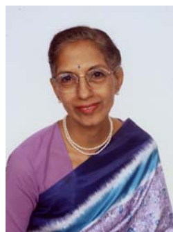
インド家庭料理研究家