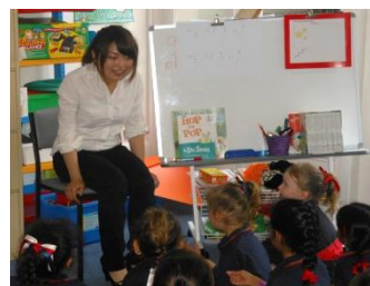
ニューサウスウェールズ大学