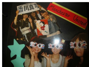
マンチェスター大学