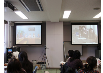
テレビ会議の様子