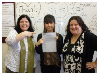
マンチェスター大学