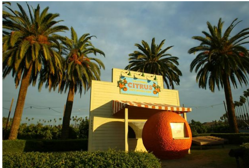
CA Citrus State Historic Park

Natural Resource Management Native Plant Enhancement Habitat Restoration Trail Construction & Maintenance