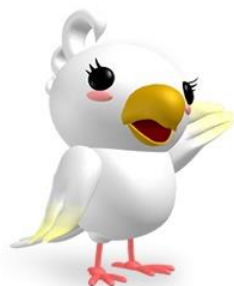
附属図書館 マスコットキャラクター おかめちゃん