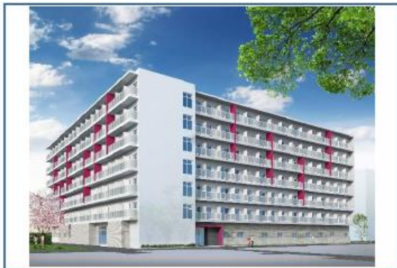
図1 外観 イメージ図