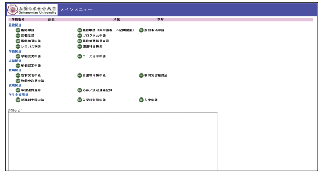
■メインメニュー画面